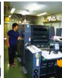
印刷機のチェック