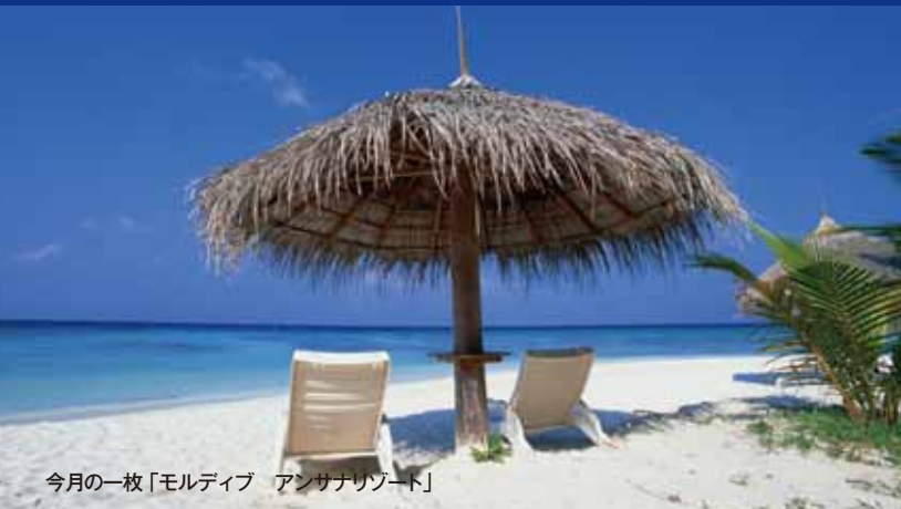
今月の一枚「モルディブ アンサンリゾート」